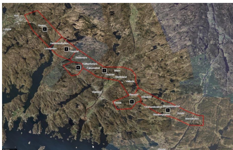
Figur 6-1: Kartet er et utsnitt fra modell og viser inndeling av analyseobjektet.

Deltakere er presentert i Tabell 6-1 og Tabell 6-2.